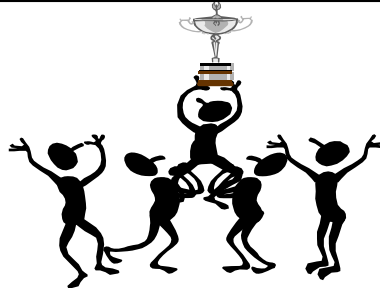
(De la page 3 à la page 14) Bilan des équipes