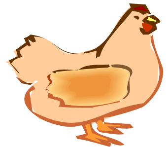
(Page 17) Prévision des poules départementales 2002

ET OUI CES DEMOISELLES ONT VRAIMENT MÉRITÉ DE FAIRE LA UNE DE CE JOURNAL, APRÈS ÊTRE MONTÉES EN MILIEU DE SAISON ELLES ONT EU LE CULOT DE TERMINER À LA SECONDE PLACE DE LEUR POULE, BRAVO!