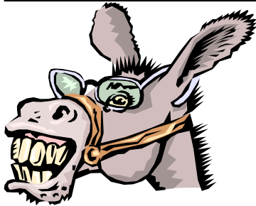
(Page 2) Le mot du président

Journal n°8 3 ème Trimestre Saison 2000/2001