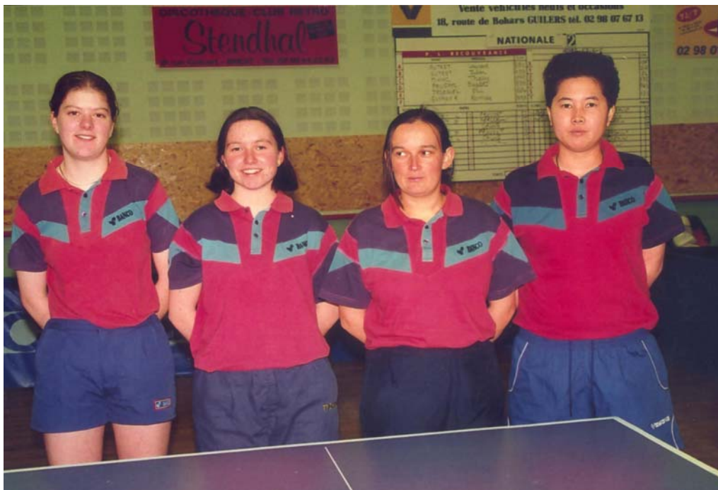
(PAGE 3,4 ET 18)

ET OUI CES DEMOISELLES ONT VRAIMENT MÉRITÉ DE FAIRE LA UNE DE CE JOURNAL, APRÈS ÊTRE MONTÉES EN MILIEU DE SAISON ELLES ONT EU LE CULOT DE TERMINER À LA SECONDE PLACE DE LEUR POULE, BRAVO!