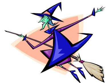
(De la page 18 à la page 24) Les échos