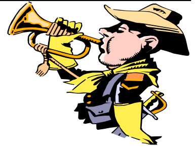
(De la page 15 à la page 16) Le classement des équipes et des individuels