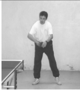
Notre président en pleine effort !!!

Nous voici déjà arrivé au mois de juin qui rime avec fin de saison, examens et bilans. L'assemblée générale et ce numéro du journal sont donc pour nous l'occasion de revenir sur le semestre passé.