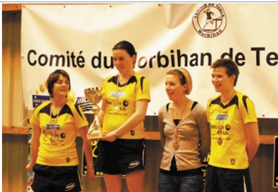
Un triplé ajiiste sur le podium du championnat du Morbihan le 25 mars à Ploërmel