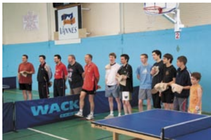
Traditionnel échange des cadeaux avant la bataille...