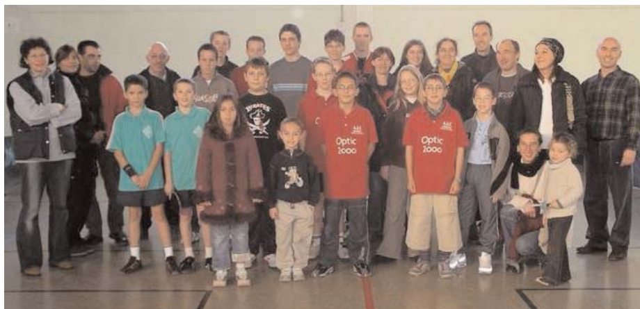
Le championnat jeune le samedi après-midi