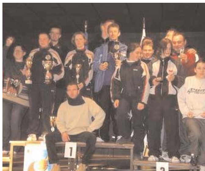
Les champions hors-catégorie....